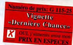
TABLEAU RECAPITULATIF • PRIX EN ESPECES

Veuillez détacher ici et coller sur le bon de commande.